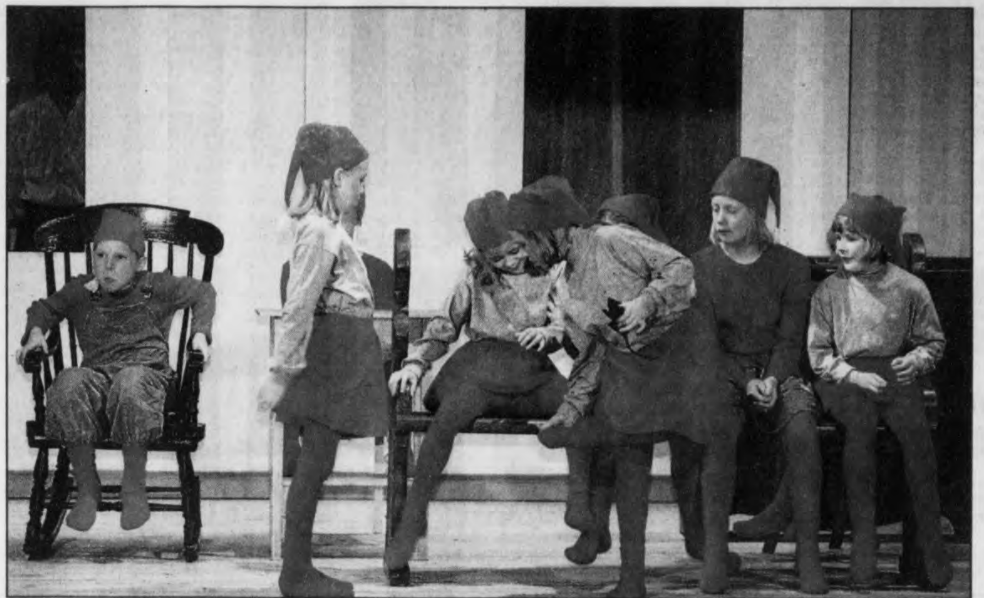
I Nøddebo Præstegård er der både synlige og usynlige nissebørn alle vegne.